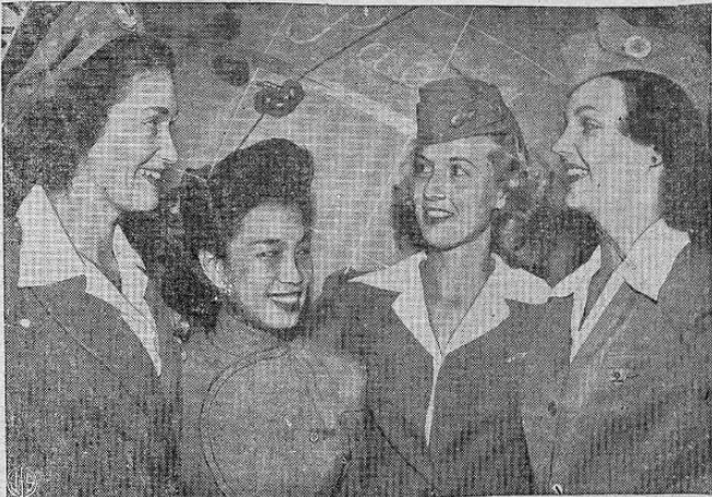
REUNION DE MESONERAS — Para probar que el aeropuerto de San Francisco es verdaderamente internacional, cuatro mesoneras del aire se reúnen en dicho aeropuerto para cambiar impresiones.